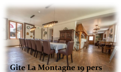
Gîte La Montagne 19 pers