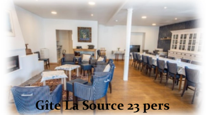
Gîte La Source 23 pers

☎ +32(0)475.70.86.66 - +32(0)475.73.63.04 - +33(0)9 72.39.31.97 – ilse@les2clefs.fr